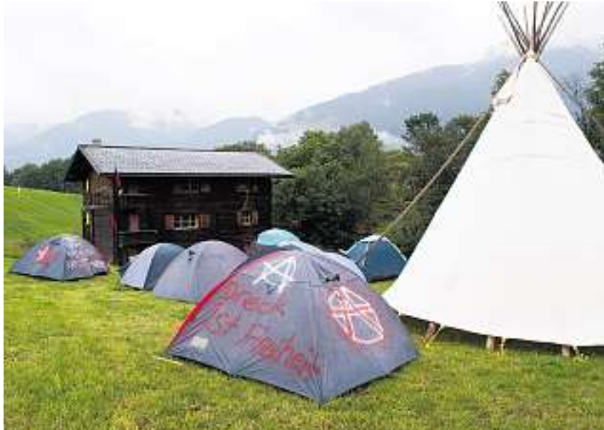
Mit Parolen gegen das bestehende System: Die Anarchisten im Zeltcamp im Lugnez bringen sich das Herstellen von «revolutionären» Spray-Schablonen bei.