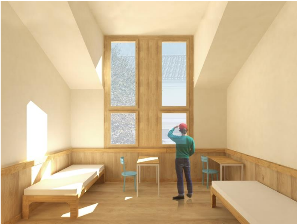
Zweibettzimmer: Patienten können ihre Privatsphäre zum Bettnachbarn mit verschiedenen Möblierungen selber steuern. Für die Pflegenden sind die Räume gut überschaubar.