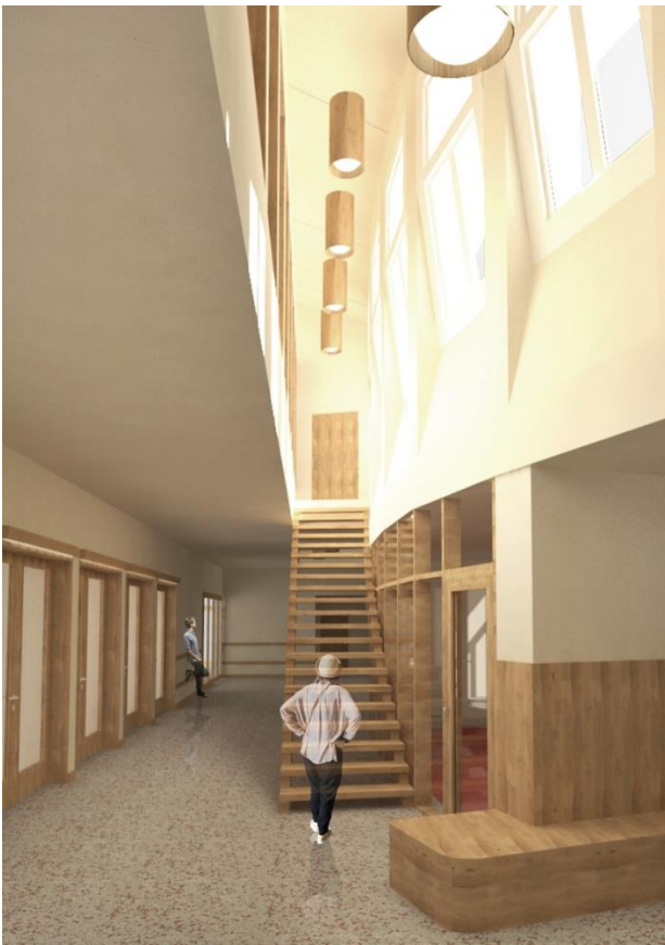
Aufenthaltsbereiche Erdgeschoss: Visuelle und räumliche Bezüge innerhalb der Klinik schaffen Offenheit und Transparenz.